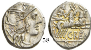
Denario 138 a.C., Crawford 231/1

Denario con Juno conduciendo una biga llevada por cabras. La diosa lleva en su mano derecha las riendas y un cetro y en la izquierda un látigo.