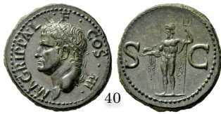
As posterior al 37 a.C., RIC Gaius 58