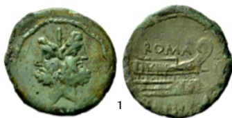
As circa 91 a.C., Crawford 339/1a

Aquí tienes ejemplos de monedas republicanas con bustos de dioses en su anverso.