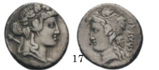
Denario 75 a.C., Crawford 386/1