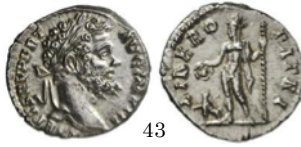
Denario 211 d.C., RIC 32