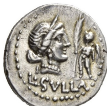
Denario 84 a.C. Crawford 359/2

En este otro denario de Sula se lee en el anverso su nombre, L. SULLA, y en el reverso que fue general por segunda vez, IMPER(ATOR) ITERUM.