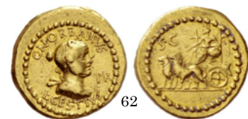
Aureo 137 a.C., Crawford 491/2

Denario con Júpiter conduciendo una biga tirada por elefantes.