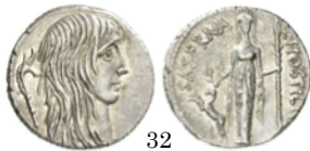
Denario 48 a.C., Crawford 448/3

Denarios imperiales. En el de Faustina aparece Juno de pie. Lleva en la mano derecha una patera y en la izquierda sujeta un cetro. A sus pies hay un pavo real, símbolo de la diosa. En el de Sabina falta no hay pavo