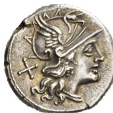
Denario 149 a.C. Crawford 210/1