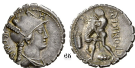
Denario 80 a.C., Crawford 380/1

En las monedas, además de los dioses olímpicos, aparecen también las musas y héroes. Algunos de estos últimos son estrictamente griegos, otros son grecorromanos y otros romanos. Así puedes encontrar a Hércules, el Heracles griego, o a Eneas, el antepasado de los romanos. También aparecen mitos propiamente romanos como el de Rómulo y Remo, el rapto de las sabinas o la muerte de Tarpeya.