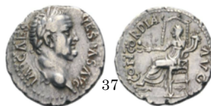
Denario 74 d.C., RIC II 336

Denarios con Ceres. En la izquierda la diosa está de pie y sujeta en la mano izquierda un cetro y en la derecha dos espigas de trigo. En la derecha está sentada y sujeta en su mano izquierda espigas de trigo y una amapola y en la izquierda una