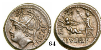
Denario 71 a.C., Crawford 320/1

Denario con Diana conduciendo una biga tirada por ciervos. Sujeta con la izquierda las riendas y con la derecha una lanza. Lleva la túnica recogida por encima de las rodillas.