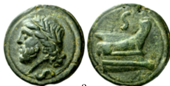
Semis, Roma circa 225-217 a.C., Crawford 35/2