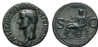
As 37-8 d.C., RIC 38