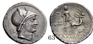
Denario 71 a.C., Crawford 400/1a

Aureo con Cibeles conduciendo una biga tirada por leones.