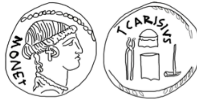
Denario de T. Carisio, 46 a.C. En el reverso aparecen los útiles para acuñar: martillo, tenazas, yunque y cuño.

La mala colocación del cóspel o un segundo golpe de martillo son algunos de los motivos de defectos en la acuñación. La acuñación de las monedas podía hacerla una sola persona o un equipo de dos o tres personas.