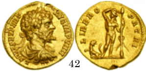
Aureo 197 d.C., RIC 99