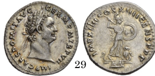
Denario Domiciano 88 d.C., RIC 576

Dupondio con Minerva. La diosa aparece con todos casi todos su atributos, casco, lanza y escudo. Le falta la lechuza. Que sí aparece en el denario de la derecha.