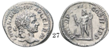
Denario Caracala 214 d.C., RIC 240

Aureo con Júpiter sentado en su trono. El dios sujeta con su mano izquierda un cetro y en la derecha sus rayos. Denario con Júpiter de pie. Lleva en la mano derecha los rayos y a sus pies hay un águila.