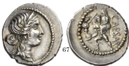
Denario 48 a.C., Crawford 458/1

Hércules aparece llevando una rama en la mano derecha y su maza y la piel del león de Nemea en la izquierda.