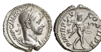
Denario Alejandro Severo 231-235 d.C a.C. RIC 246

En las monedas se emplean solamente tres casos, nominativo para nombrar; genitivo para indicar pertenencia o filiación; dativo para indicar a quién está dedicada la moneda.