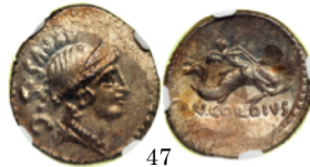
Denarius 46 a.C., Crawford 463/3