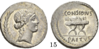
Denario 67 a.C., Crawford 408/b1