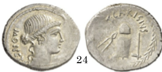
Denario 46 a.C., Crawford 464/2

Denario con la cabeza de Cupido. En la espalda se le ven las alas, y el arco las flechas.