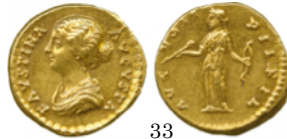
Aureo Faustina 157-161 d.C., RIC 494b.

Denario con Diana. La diosa de pie mirando de frente y sujeta en la mano izquierda una lanza y en la derecha un ciervo. Aureo con Diana. La diosa lleva el arco y una flecha