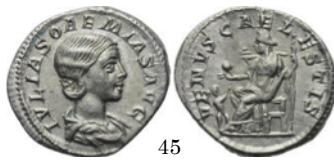
Denarius Julia Soemias 204 d.C. d.C., RIC 243