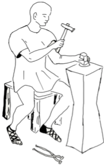
Malleator golpeando un cuño.