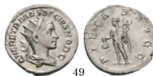
Antoniniano Herenius etruscus., RIC 142b