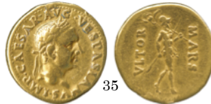
Aureus 69-79, RIC 1297

Denario con Marte. El dios avanza con sus armas una lanza y un escudo. Aureo con Marte. El dios, en esata ocasión desnudo, lleva una lanza y un trofeo.