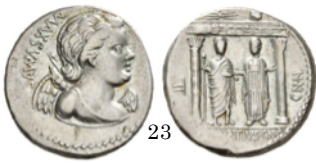
Denario 75 a.C., Crawford 391/2

Denario con la cabeza de Vulcano. El dios lleva cubierta la cabeza con un pileus laureado. Detrás se ven unas tenazas, una de sus herramientas como herrero.