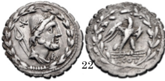
Denario serrato 105 a.C., Crawford 314/1b

Denario con la cabeza de Neptuno. Detrás se ve su tridente. En el reverso se ve otra vez a Neptuno por un defecto de acuñación.