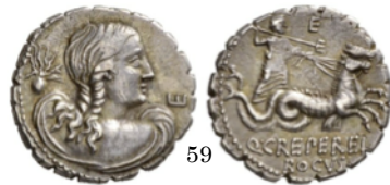
Denario serrato 72 a.C., Crawford 399/1

Denario con Juno conduciendo una biga llevada por cabras. La diosa lleva en su mano derecha las riendas y un cetro y en la izquierda un látigo.