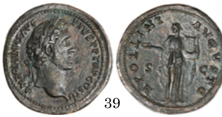
Sestercio Antonio Pio 140-144, RIC 598

Denario con Apolo. El dios está de pie. Lleva corona. En la mano izquierda sujeta una lira y en la derecha una rama. Sestercio. El dios está de pie, vestido, corona de laurel en la cabeza y una lira en el brazo izquierdo