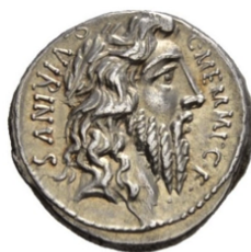
Denario 56 a.C. Crawford 427/2

Además del monedero también puede aparecer otros dato. En este denario, por ejemplo, a parece el nombre del personaje de la leyenda, el dios Quirino, el monedero y el hecho que conmemora la moneda, la institución de los juegos en honor a Ceres. En el anverso se lee por detrás de la cabeza y en el sentido contrario a las agujas del reloj QUIRINUS y por delante C(AIUS) MEMMI(US) C(AII) F(ILII)US. En el reverso y en el sentido del reloj se lee MEMMIUS AED(ILIS) CERIALIA PREIMUS FECIT.