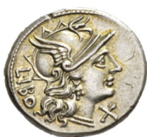
Denario 148 a.C. Crawford 915/1

En época republicana en el anverso figuraba el nombre del monedero. Puede aparecer todo en el reverso o aparecer el cognomen en el anverso. En el reverso también puede aparecer la filiación.