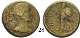
Dupondio 46 a.C., Craford 476/1a

Aureo con Júpiter sentado en su trono. El dios sujeta con su mano izquierda un cetro y en la derecha sus rayos. Denario con Júpiter de pie. Lleva en la mano derecha los rayos y a sus pies hay un águila.