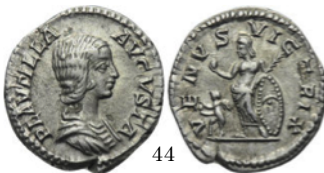
Plutilla 202 d.C. d.C., RIC Caracalla 369