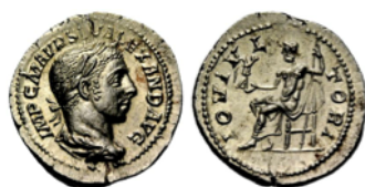
Denario Alejandro Severo 231-235 d.C a.C. RIC 144

En el reverso en lugar de los cargos del emperador puede aparecer el nombre de la divinidad en diferentes casos según se la nombre o se indique que la moneda le está dedicada. Estos dos denarios de Alejandro Severo son un ejemplo: en el de la izquierda se lee en el reverso IOVI VLTORI y en el de la derecha MARS VLTOR