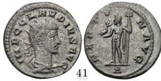
Denario Claudio II Gótico, 268 d.C., RIC 214