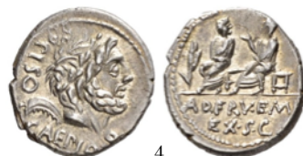
Denarius 100 a.C., Crawford 330/1a

As con la cabeza de Jano bifronte. En ocasiones aparecen con el aspecto de Jano otros personajes como ocurre en el as de la derecha. El personaje en cuestión es, en