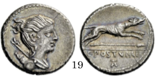
Denario 56 a.C., Crawford 426/1