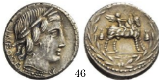
Denario 85 a.C., Crawford 353/1d