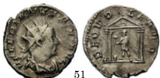
Antoninianus Valeriano I 256 d.C., RIC 5

As con Neptuno de pie y con capa. El dios sujeta con su mano izquierda el tridente y en la derecha lleva un pequeño delfín. En el denario el dios presenta el