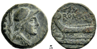
Triens 86 a.C., Crawford 350/B2a

Semis con la cabeza de Saturno. En los denarios, además de la cabeza de Saturno barbado, suele aparecer una hoz que puede ser dentada o no serlo. Saturno era