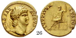
Aureus Nerón 64-64 d.C., RIC 52

Estos son ejemplos de dioses que aparecen en los reversos. Se encuentran tanto en monedas republicanas como imperiales. Unas veces aparecen de pie o sentados y otras en un carro.