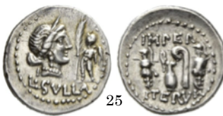
Denarius 84-83 a.C., Crawford 359/2

Denario con la cabeza de Venus con diadema y Cupido de cuerpo entero. Cupido lleva alas en la espalda.