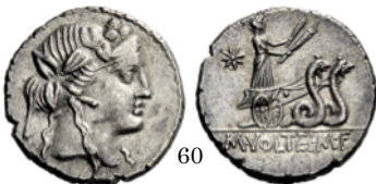
Denario 78 a.C., Crawford 385/3

Denario con Neptuno conduciendo una biga tirada por hipocampos. El dios sujeta las riendas con la izquierda y su tridente con la derecha.