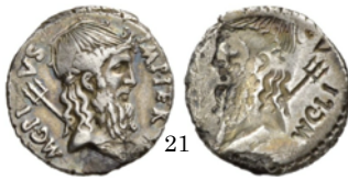
Denario Sicilia 42 a.C., Crawford 511/2 a o 2b

Denario con la cabeza de Neptuno. Detrás se ve su tridente. En el reverso se ve otra vez a Neptuno por un defecto de acuñación.