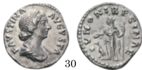
Denario Faustina 161-164 d.C., RIC 696

Dupondio con Minerva. La diosa aparece con todos casi todos su atributos, casco, lanza y escudo. Le falta la lechuza. Que sí aparece en el denario de la derecha.