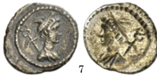
Sextans Cerdeña, antes del 211 a.C., Crawford 56/6