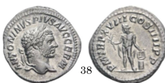
Denario 215 d.C., RIC 254

Denarios con Ceres. En la izquierda la diosa está de pie y sujeta en la mano izquierda un cetro y en la derecha dos espigas de trigo. En la derecha está sentada y sujeta en su mano izquierda espigas de trigo y una amapola y en la izquierda una