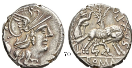
Denario 4137 a.C., Crawford 235/1c

Denario con Eneas. El héroe lleva a su padre en el brazo izquierdo y los penates en la mano derecha.