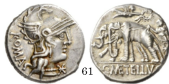
Denario 125 a.C., Crawford 269/1

Denario con Ceres conduciendo una biga llevada por serpientes. La diosa sujeta en sus manos dos antorchas.