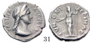
Denario Sabina 128-136 d.C., RIC 395a

Denarios imperiales. En el de Faustina aparece Juno de pie. Lleva en la mano derecha una patera y en la izquierda sujeta un cetro. A sus pies hay un pavo real, símbolo de la diosa. En el de Sabina falta no hay pavo