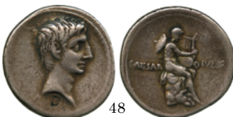
Denario c. 31 a.C., RIC 257