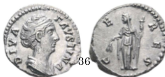
Denario Faustina 141-161 d.C., RIC 378.

Denario con Marte. El dios avanza con sus armas una lanza y un escudo. Aureo con Marte. El dios, en esata ocasión desnudo, lleva una lanza y un trofeo.