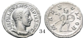
Denario 232 d.C., RIC 246

Denario con Diana. La diosa de pie mirando de frente y sujeta en la mano izquierda una lanza y en la derecha un ciervo. Aureo con Diana. La diosa lleva el arco y una flecha