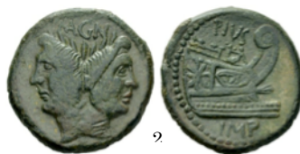
Pius as, Sicilia circa 42-38 a.C., Crawford 479/1