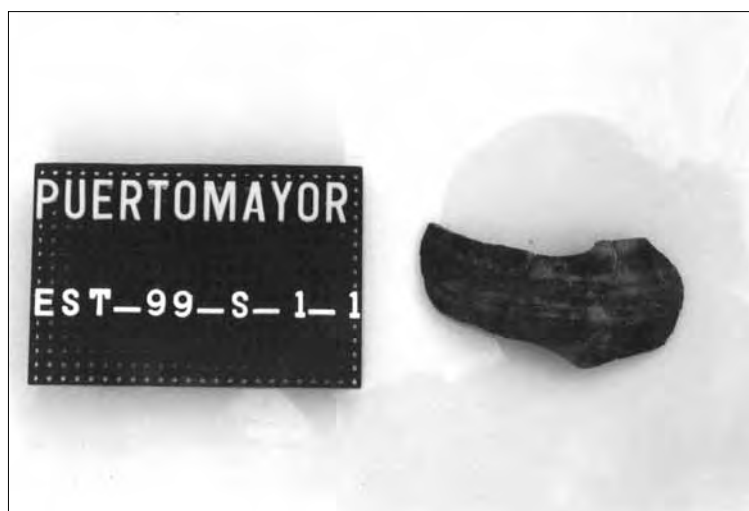
Lámina 3. Fragmento de recipiente de cerámica vidriada.