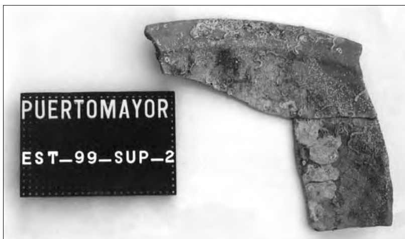
Lámina 4. Fragmento de lebrillo.

MAS GARCÍA, J. (1973): "Breve síntesis de la campaña arqueológica submarina en la provincia marítima de Cartagena" Mastia 4-5. Cartagena, pp. 51-52.