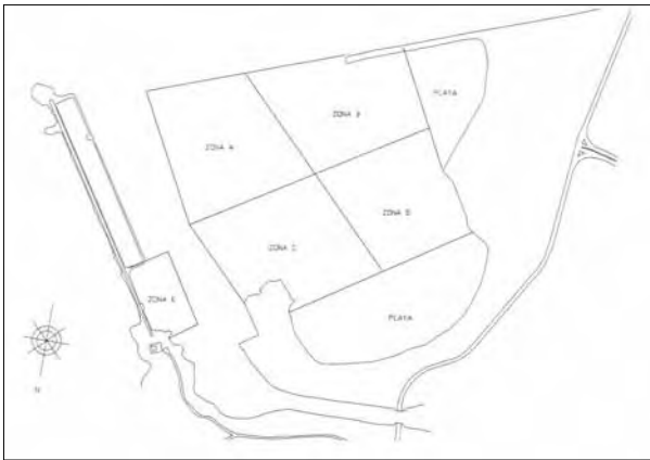
Figura 1. Áreas de prospección subacuática.