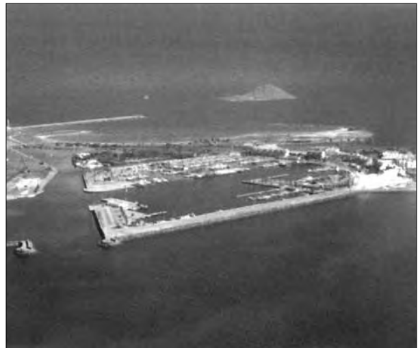
Lámina 1. Vista general de la zona de prospección.

– Escolletes II, actualmente bajo el malecón de este puerto, ofreció tipos anfóricos al parecer inéditos, de diferente capacidad pero de homogénea morfología y llamadas por su autor “Escolletes” que pudieran corres-