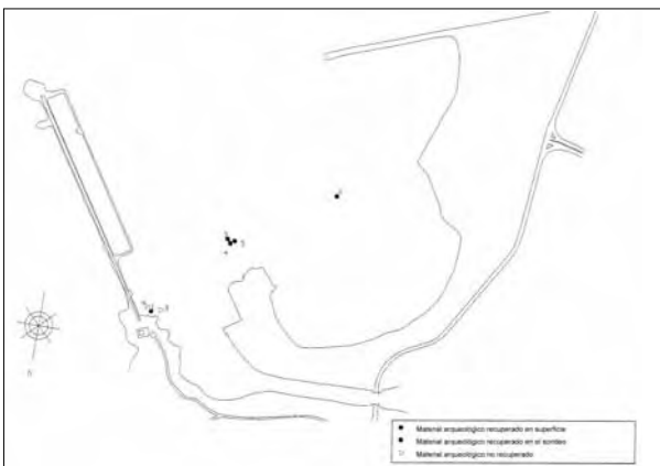
Figura 2. Plano de los hallazgos arqueológicos.