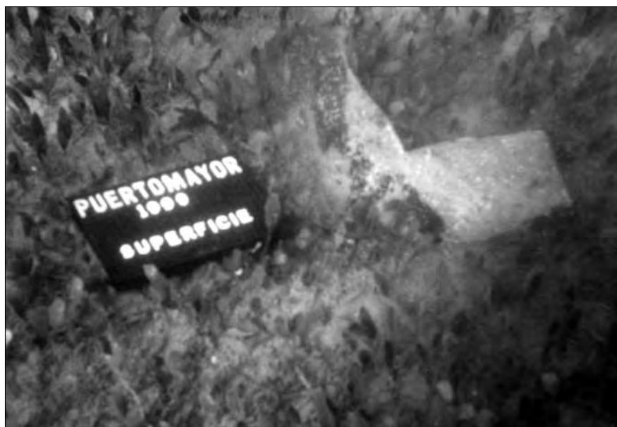
Lámina 2. Material arqueológico en superficie.

Tras los trabajos de J. Mas, muy pocas intervenciones se han hecho en esta importante área, hoy en día, salvo unas pocas actuaciones en concreto, no tenemos una idea muy clara de estos yacimientos.